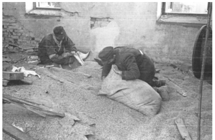
Na zdjęciu widać zbieranie jęczmienia w magazynie na zupę plujkę.

https://gs24.pl/zupa-plujka-golebie-i-zoledzie-kuchnia-polowa-w-powstaniu-warszawskim-co-jedli-powstancy/ar/c17-16538967