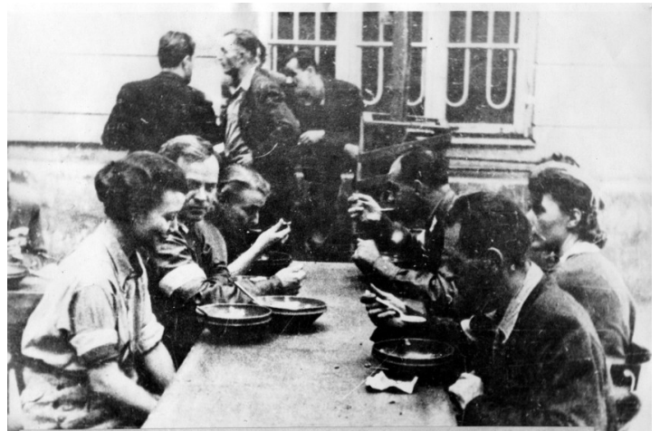
Powstańcy jedzą wspólny posiłek.

Myśląc o kuchni powstańczej, warto pamiętać, że była to też niebezpieczna praca. W każdej chwili obok budynku mogła spaść bomba. Przez to obsypujący się tynk, kurz lub ziemia mogła wpaść do gotującej się zupy, lub siła rażenia pocisku mogła ją rozlać. W najgorszym razie spadająca bomba na budynek kuchni polowej niszczyła ją doszczętnie wraz z gotującymi w niej kucharkami.