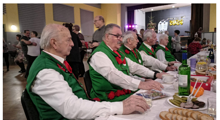
Biesiada w Syrnii