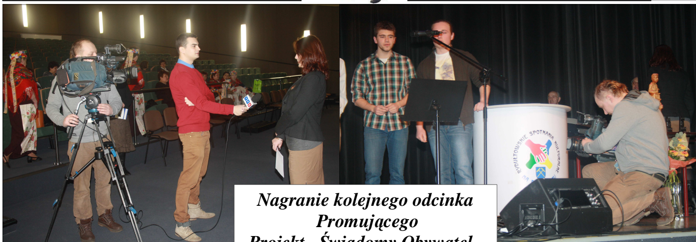
Nagranie kolejnego odcinka Promującego Projekt „Świadomy Obywatel”, przez telewizję TVS