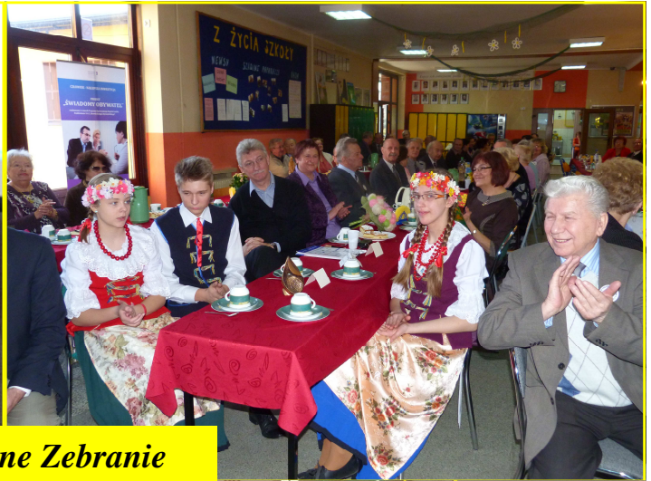
Walne Zebranie Członków TMR-u