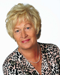
Redaktor wydania: Elżbieta Jankowska