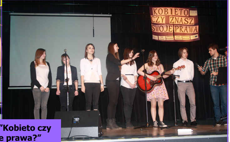
Spotkanie pt. "Kobietę czy znasz swoje prawa?"