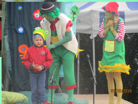
Festyn na os. Karola