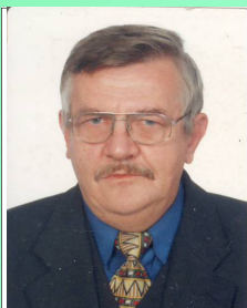
Redaktor wydania: Stanisław Brzęczek