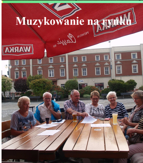
Muzykowanie na rynku