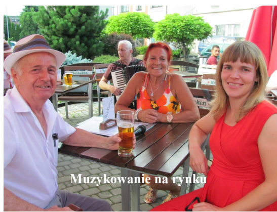
Muzykowanie na rynku