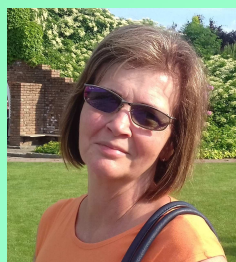
Redaktor wydania: Joanna Rusok