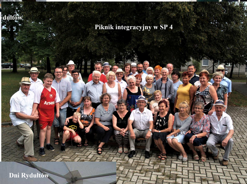
Piknik integracyjny w SP 4