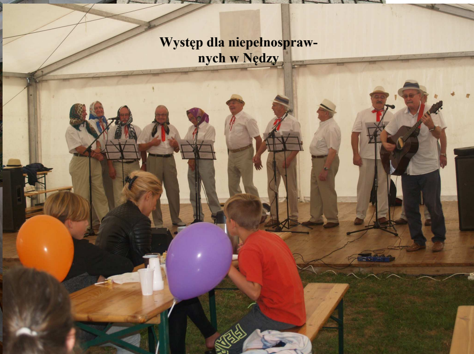
Występ dla niepełnosprawnych w Nędzy